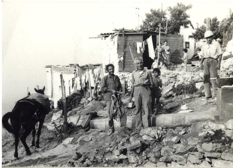
Construcció de barraques al Carmel, cap a l'any 1955.

El 1949, les autoritats franquistes organitzen el 'Servicio de Control y Represión del Barraquismo', que, entre altres mesures, aplica retornar els nouvinguts als llocs d'origen: la ciutat oficial reprimeix el barraquisme però alhora el tolera, sobretot quan el creixement econòmic es reprèn i es necessita mà d'obra per a la indústria, el comerç o el servei domèstic. A finals dels anys cinquanta s'arriba a la màxima expansió, amb unes 20.000 barraques i unes 100.000 persones. A partir dels anys seixanta, l'acció comunitària dels assistents socials va anar acompanyada del sorgiment d'un teixit associatiu i reivindicatiu, la llavor de futurs moviments veïnals que van aconseguir algunes millores als barris i van reclamar pisos. L'eradicació dels barris de barraques va durar dècades. Sovint s'eliminaven per fer-hi actuacions urbanístiques: les barraques de la Diagonal, l'any 1952, per a la celebració del Congrés Eucarístic Internacional; les de Maricel, a Montjuïc, el 1964, per fer-hi el parc d'atraccions; les de Can Tunis, per construir la Ronda Litoral. El Somorrostro es va anar enderrocant per fer lloc al Passeig Marítim. Malgrat la construcció de polígons d'habitatges als anys seixanta i setanta, els últims nuclis no van desaparèixer fins poc abans dels Jocs Olímpics del 1992.