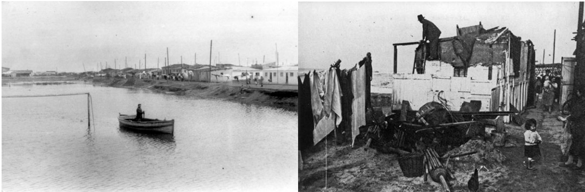
Efectes dels temporals al Camp de la Bota i al Bogatell.

Els temporals de 1932 i 1934 van destruir moltes cases, i part dels habitants van fer barraques prop del castell. El barri de Pequín ja rebia el nom de Camp de la Bota, i a finals dels anys quaranta va sumar les barraques del nucli veí del Parapet, al terme de Sant Adrià de Besòs.