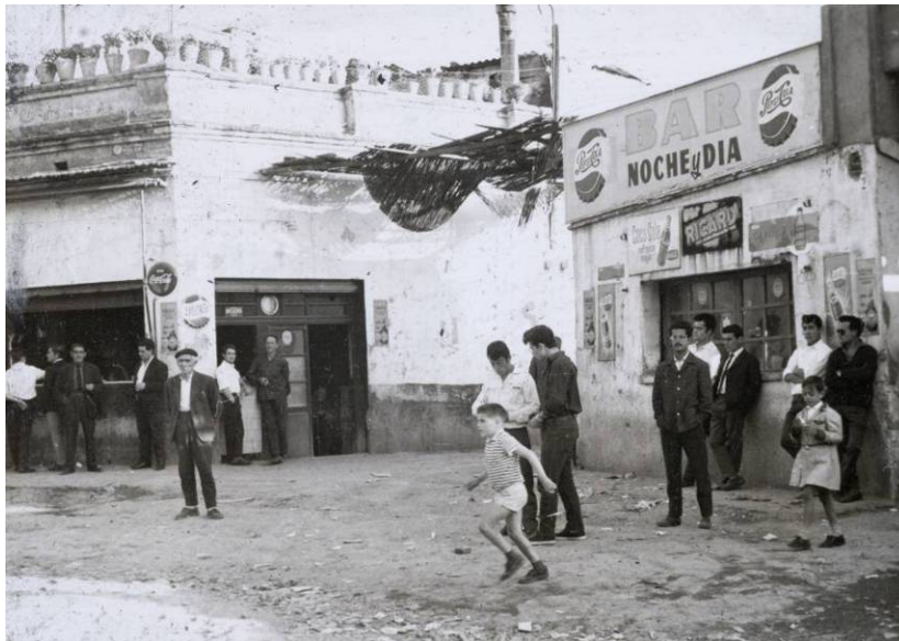
Can Valero a Montjuïc, anys 50. 'El barraquismo en Montjuïc.' Marcial Echenique. Arxiu Municipal Contemporani de Barcelona

A partir dels anys seixanta, l'acció comunitària dels assistents socials va anar acompanyada del sorgiment d'un teixit associatiu i reivindicatiu, la llavor de futurs moviments veïnals que van aconseguir algunes millores als barris i van reclamar pisos.