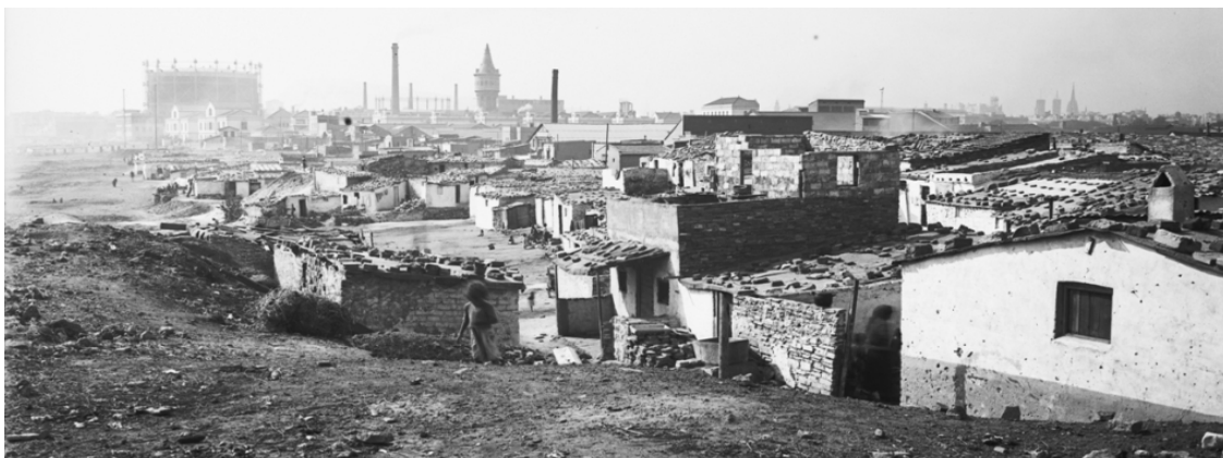
Barri del Somorrostro, c. 1950.