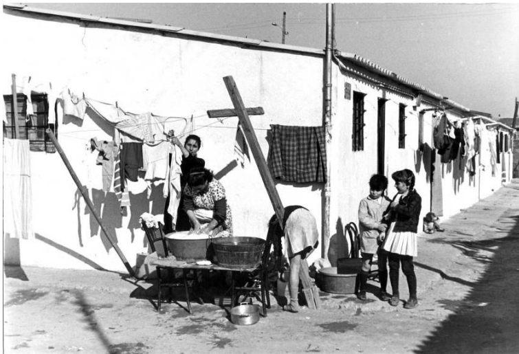
Vida quotidiana al Camp de la Bota, 1967.

Els barris van sorgir a finals del segle XIX i principis del segle XX. La població era gent treballadora procedent majoritàriament del País Valencià, Múrcia, Aragó i Andalusia. Els barris del Camp de la Bota i Rere Cementiri són els últims que van enderrocar, just abans dels Jocs Olímpics del 1992.