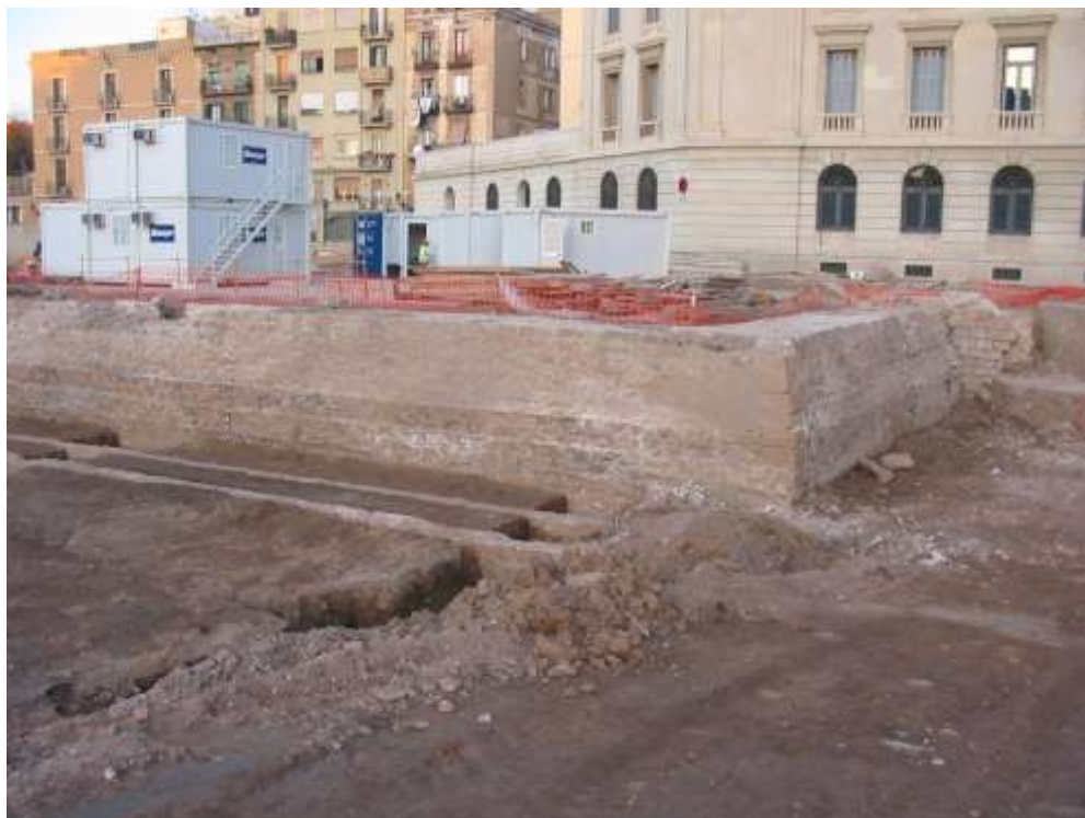
El baluard de Migdia; al davant, una de les canalitzacions documentades