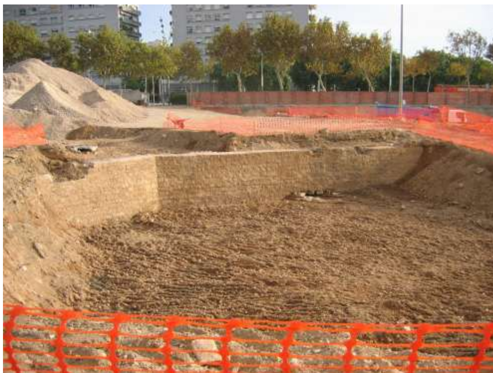
Tram de la contraescarpa documentat al solar del Patronat de l'Habitatge. L'excavació arqueològica es completarà a partir de les cotes que es veuen a la imatge