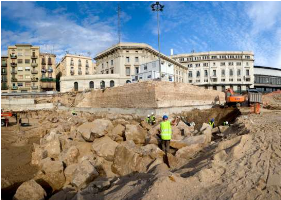
L'escullera del segle XV en procés d'excavació i el baluard de Migdia

Possiblement, tampoc no es localitzi cap tram del Rec Comtal que es va desviar arran de la construcció de la Ciutadella (segons la planimetria històrica conservada, el traçat passaria per sota el carrer d'Ocata), però si la canalització de la derivació de Rec Comtal excavada en el solar del costat. També és previst deixar a la vista tot el tram de la contraescarpa conservada en en solar.