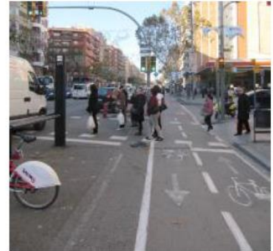
CARRIL BICICLETA ACTUAL

El carril bici, de doble sentit i de 2 metres d'amplada està flanquejat per dues franges laterals de protecció. Al cantó del Poble-sec, un parterre de gespitosa Zoysia tenuifolia (1.20 metres d'amplada) i al cantó de l'Eixample-Ciutat Vella unes peces separadores de cautxú de secció. El carril bicicleta està pavimentat amb el mateix aglomerat asfàltic que la calçada de vehicles i s'executarà alhora.