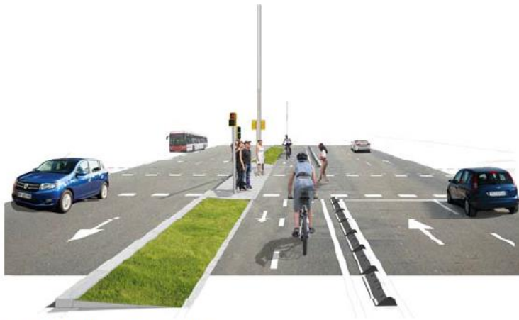
NOU CARRIL BICICLETA CENTRAL