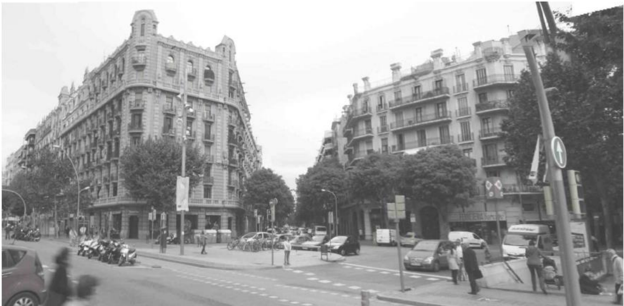
Imatge estat actual

Es planteja que aquests espais de plaça siguin espais amb un mínim nombre d'elements de mobiliari urbà per tal de permetre la màxima flexibilitat d'aquests espais i la seva versatilitat d'ús.